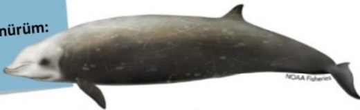
Cuvier gagalı bali-

Nefesimi iki saat tutabil- diğim için en iyi dalışı ben yaparım. Ayrıca yüz- geçlerimi vücudumun yanlarına saklarım böylece daha hızlı dalarım. Bir panda gibi görünürüm: