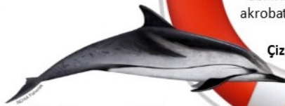
Çizgili yunus, 2,5 m

Yaşam tarzım hızlı ve hırslıdır. Süper hızlı yüzerim, boyumun üç katın- dan fazla yüksekliğe zıplay- abilirim (9 m kadar) ve akrobatik hareket etmeyi severim. Çizgilerime bak: