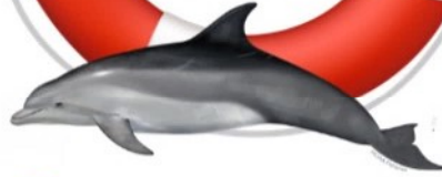
Afalina, 4 m

Ben çok zekiyim. Diğer hayvanların dillerini öğrene- bilirim ve matematikte gerçekten iyiyimdir. Su yosunlarını kolye olarak takarım. Böyle görünüyorum: