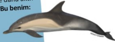
Tırtak, 2 m

1000 yunusluk büyük gru- plarla yaşarım. Geceleri gündüzlere göre daha aktif hareket ederiz. Bu benim: