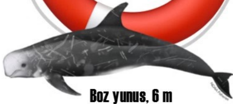
Boz yunus, 6 m

Yunuslar arasında en büyük olan benim ve 30 yıl yaşayabilirim. Üst çenemde hiç diş yok. Bana bak: